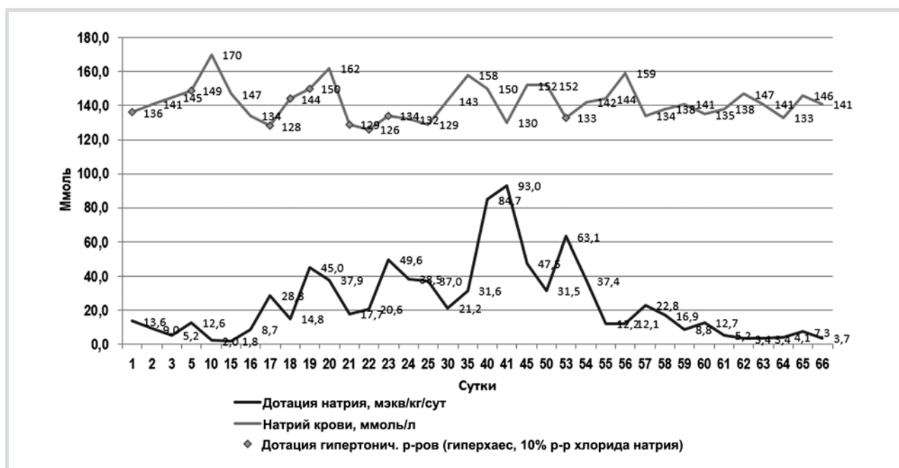
Рис. 2. Динамика концентрации натрия в плазме.